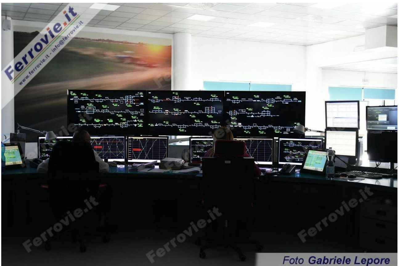
7/8. Foto Gabriele Lepore, 26 novembre 2024