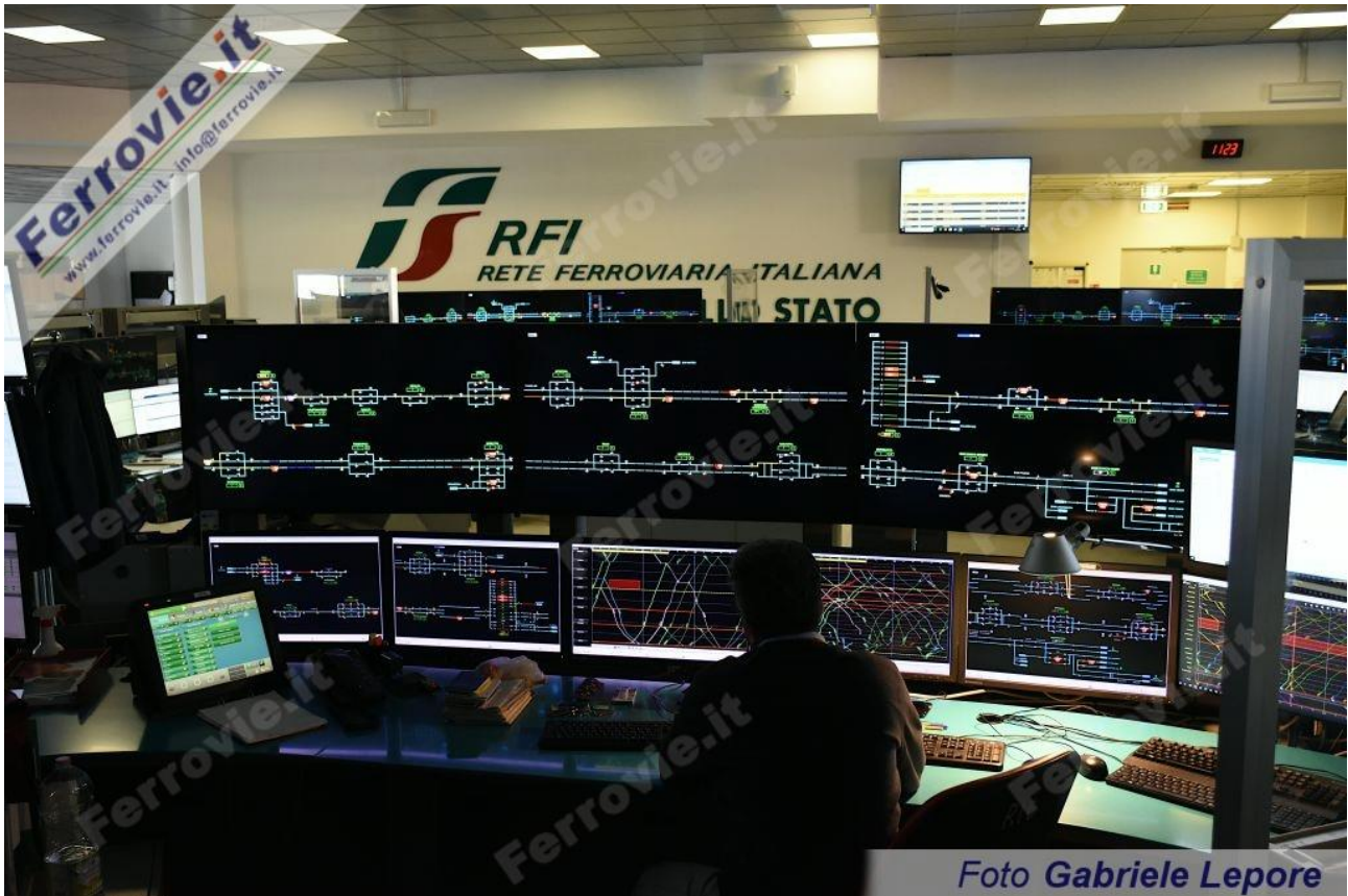
4/5/6. 26 novembre 2024